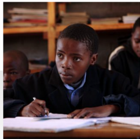
EDUCACIÓN DE CALIDAD