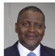
ALIKO DANGOTE Presidente/Director Ejecutivo de Dangote Industries LTD y Presidente de la Fundación Dangote