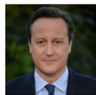
EL RT HON DAVID CAMERON Ex Primer Ministro del Reino Unido