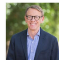
JOHN DOERR Presidente, Kleiner Perkins