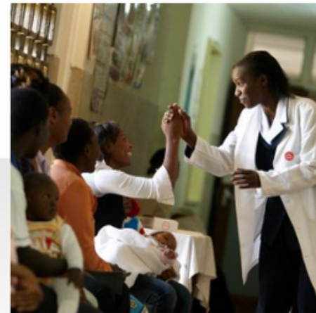
BUENA SALUD Y BIENESTAR