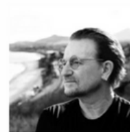
BONO Cantante principal, cofundador de U2, ONE y (RED)