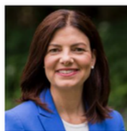
KELLY AYOTTE Ex senador de los Estados Unidos