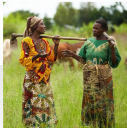
IGUALDAD DE GÉNERO